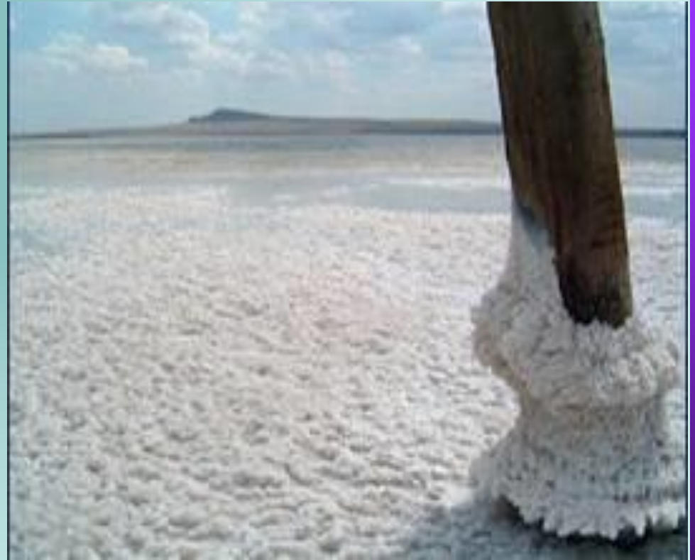
из соленых озер