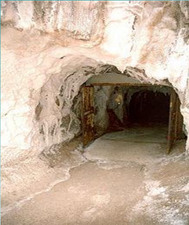
из соляных шахт